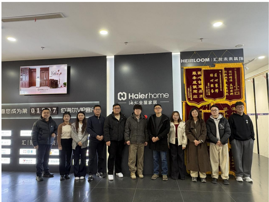
淄博海尔全屋定制综合实训