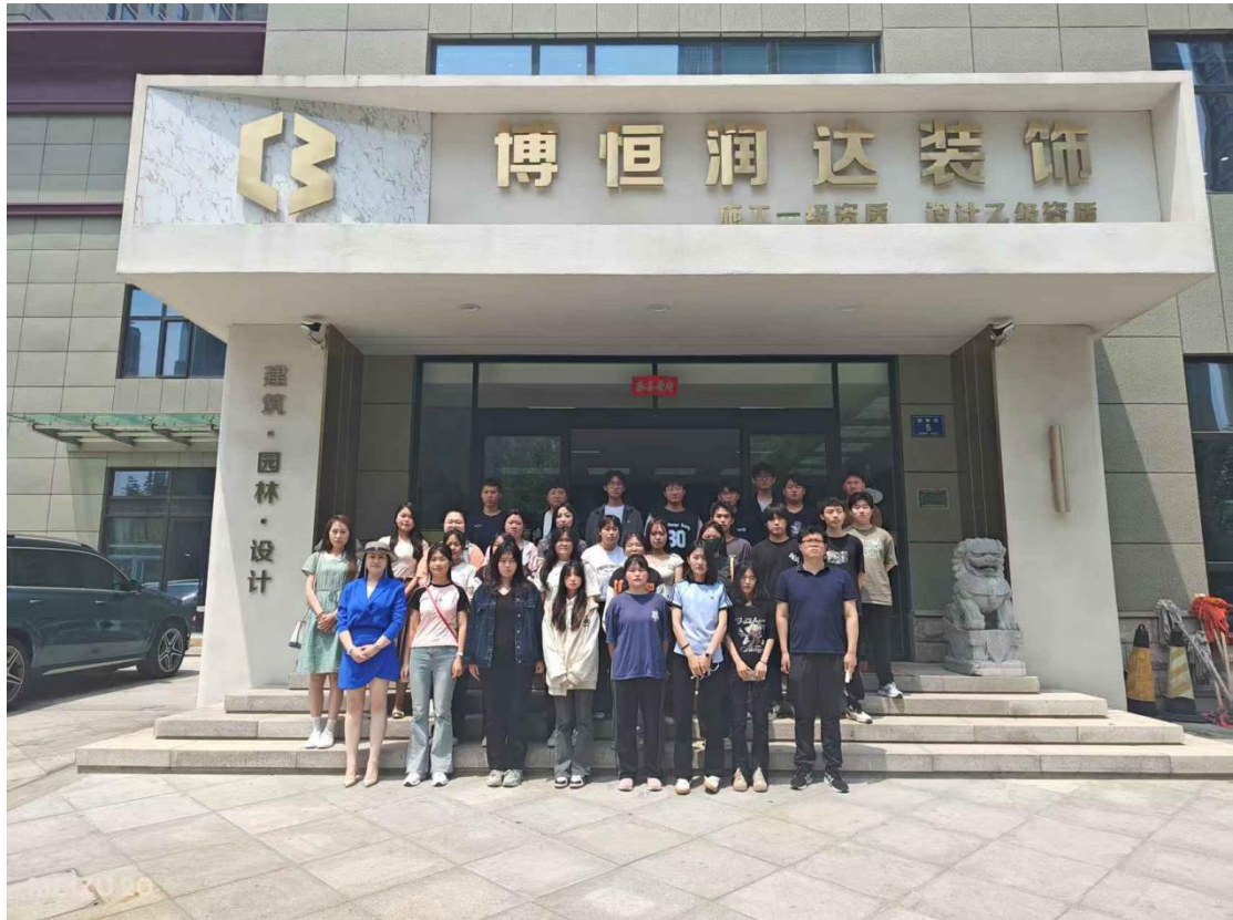
淄博博恒润达装饰公司综合实训

环境艺术设计专业推行工作室项目化教学，联动本地装饰企业、家居产业园，引入家装工装、全屋定制、数字展厅等真实项目，校内教师与企业设计师双导师协同指导。围绕环境空间设计、室内设计实务、AI设计应用等课程开展项目实训，重点融合人工智能优化设计概念、方案制作等全流程技术环节。学生分组完成完整设计项目，采用企业标准评价成果交付，深化岗课赛证融合，着力培养掌握人工智能辅助环境设计技术、适配区域行业需求的实战型设计人才。