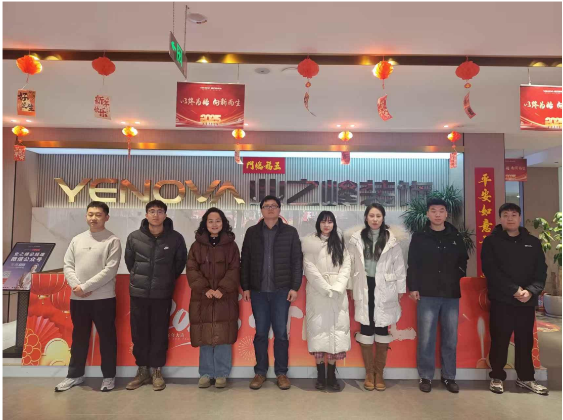
淄博业之峰装饰公司综合实训