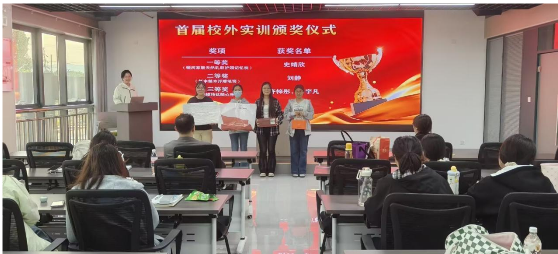
校外实训基地颁奖