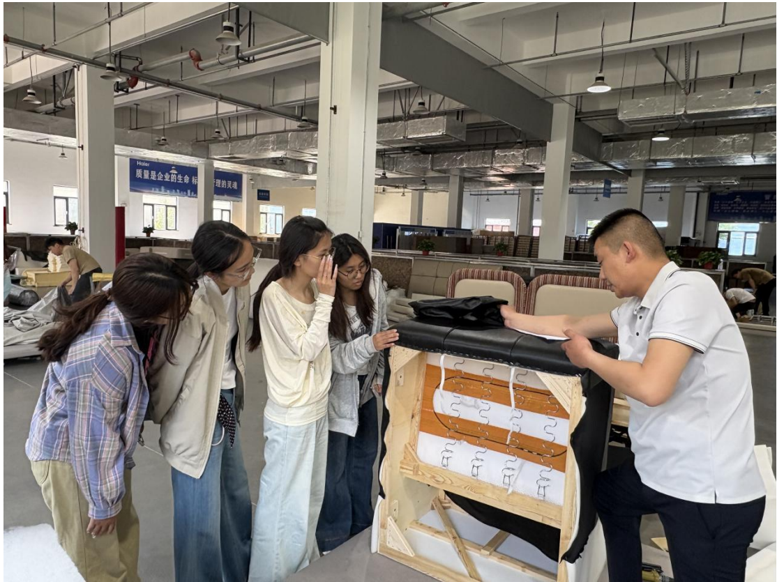
软体家具设计实训

家具制图、家具数字化设计、三维软件应用、智能家居、家具材料与工艺、家具制造装备、家具造型设计、家具结构设计。