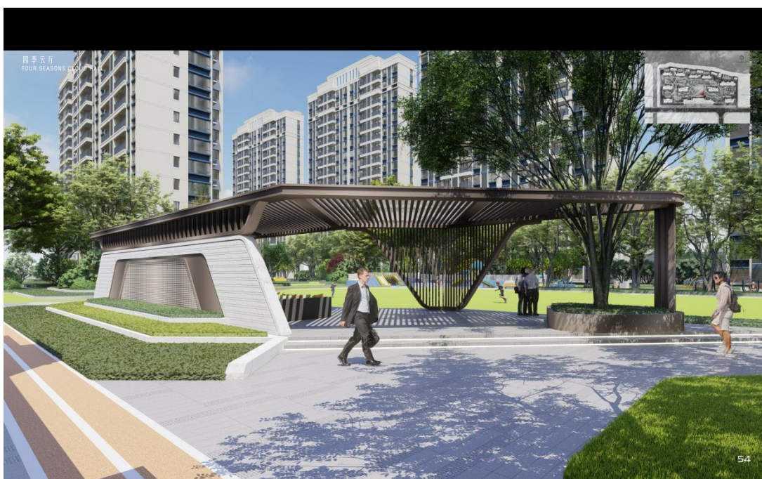
景观空间设计案例