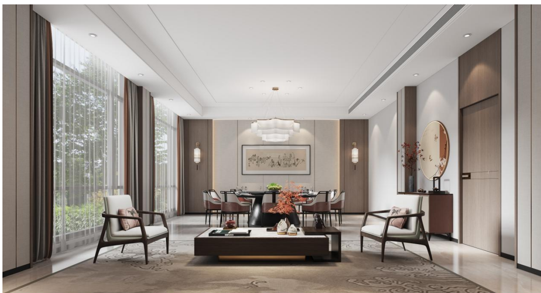
公共空间设计案例