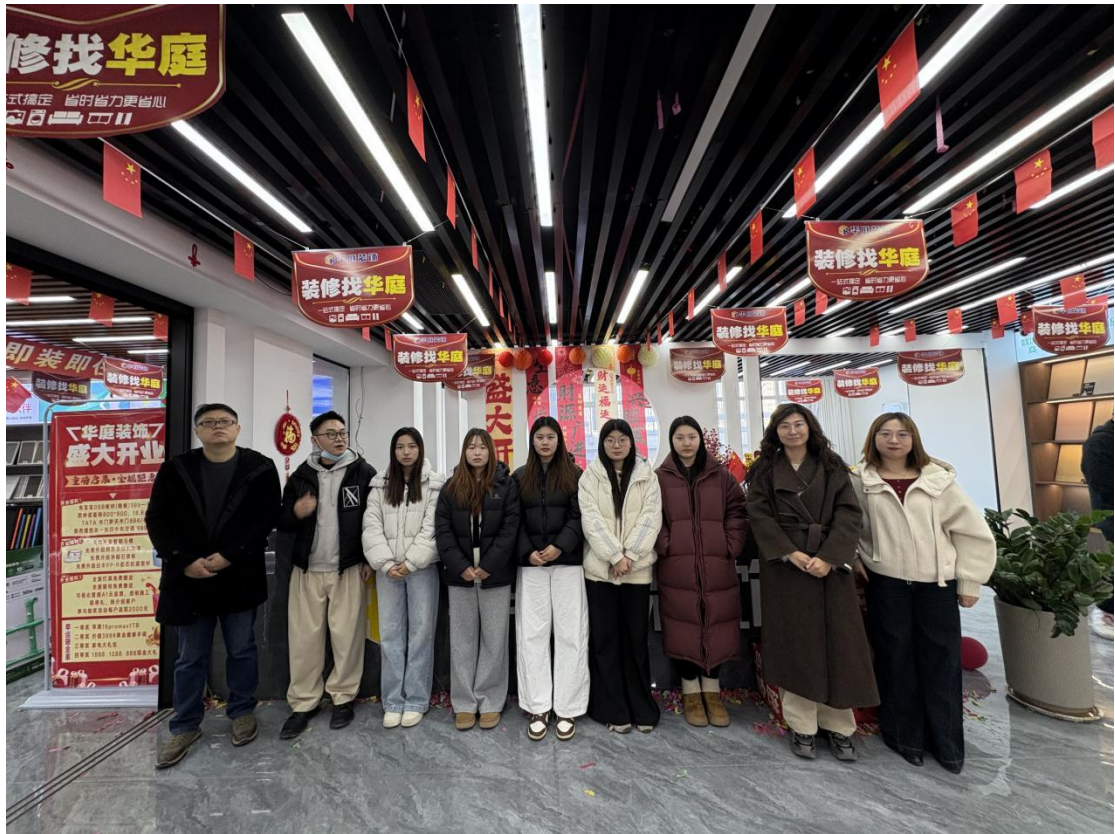
淄博华庭美居装饰公司综合实训