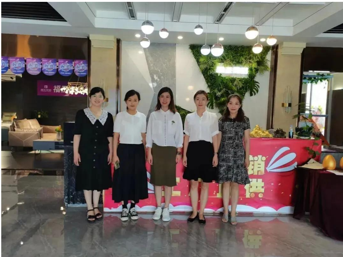
艺术设计系教师企业走访