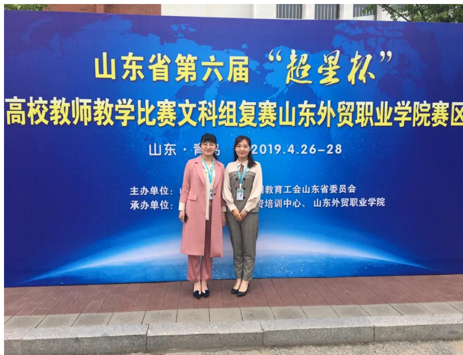
艺术系教师在高校教师教学比赛现场

学生数与本专业专任教师数比例为 16 : 1，双师素质教师占专业教师比例为 88.2%，专任教师队伍中副教授 4 人；国家职业技能鉴定高级考评员、考评员 5 人；专任教师 17 名，兼职教师 17 名，其中博士学位 1 名，硕士学位 19 名，达 83%，拥有山东省“首席技师” 2 人，高级技师 7 人，“山东省劳动技术能手” 2 人；山东省“十佳设计师” 2 人；国家职业技能鉴定考评员 3 人；全国职业院校技能大赛裁判员 1 名；国家级教育教学指导委员会副主任委员 3 人。获山东省教师教学技能大赛或指导学生参加省级及以上大赛获奖 150 余项；另聘有多名具有丰富实践经验的高级设计师及工程技术人员担任兼职教师和校外实习实训教师。