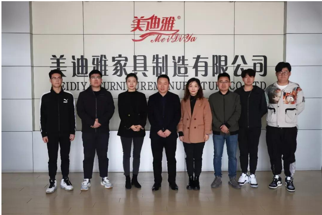
艺术设计系教师企业走访