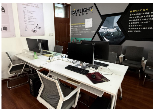
设计与制作一体化工作室

本专业现已建成广告传媒工作室、设计与制作一体化工作室、计算机辅助设计实训室等 5 个校内实训室。与企业共建线上设计与制作工作室、广告创新创业孵化基地等校企深度融合工作室。