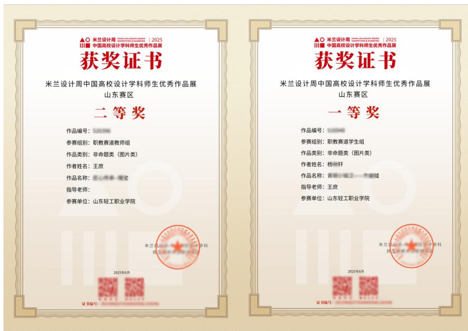
设计大赛获奖证书