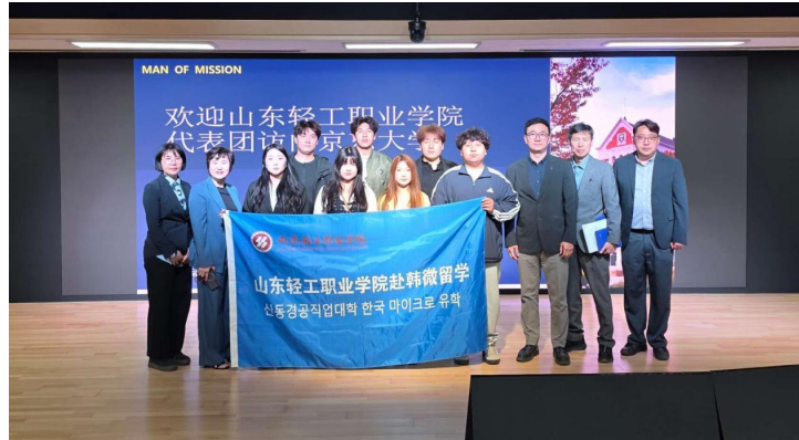
艺术设计系微留学活动

长期开展与京东大学微留学，师生交流互访等国际交流活动。项目整合中韩艺术教育资源，推动两国设计文化交流互鉴，助力学生构建国际化商业设计思维。