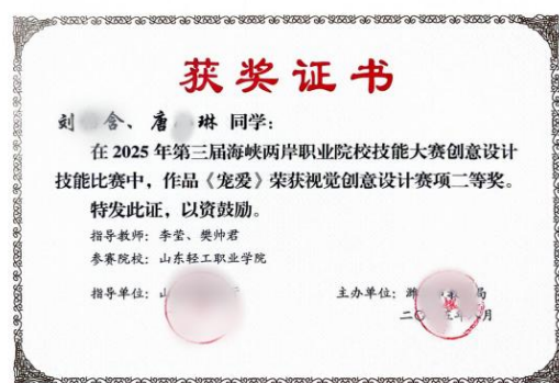
技能大赛获奖证书